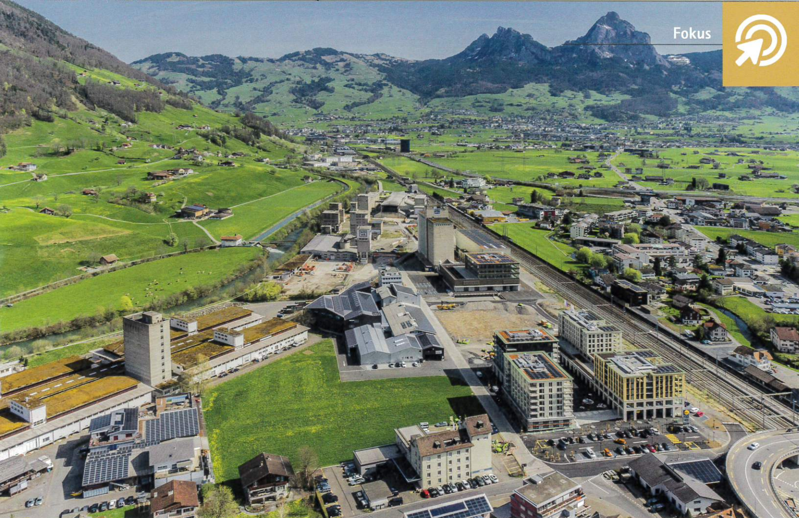
Das Areal von Brunnen Nord, aufgenommen von einer Drohnenkamera.

ternehmerin, die von der Finanzierung über die Planung bis zur Realisierung alles aus einer Hand anbietet. Sie hat 2017 das Areal der ehemaligen Zementfabrik der Schwyzer Kantonalbank abgekauft, die es ihrerseits 2009 von der Holcim erworben hat. Die Schwyzer Staatsbank hat erste Ideen zur Nutzung des mit 60 000 m 2 grössten Areals in Brunnen Nord entwickelt und in die Nova Brunnen Immobilien AG eingebracht, sich dann jedoch entschlossen, das Areal zu verkaufen.