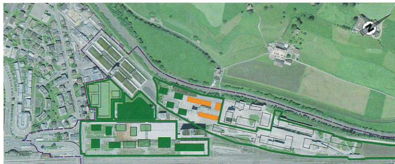
Die Karte zeigt das Entwicklungsgebiet, das in verschiedene Bereiche mit unterschiedlichen Eigentumsverhältnissen unterteilt ist. Karte Gemeinde Ingenbohl-Brunnen.

Der Bauherr will Nova Brunnen etappenweise realisieren und mit Investitionen von geschätzten 300 Millionen Franken «eine grosse Vielfalt verwirklichen». «Das Quartier müsse als Gesamtes funktionieren, es muss mit Leben erfüllt werden. Bei der Grösse des Areals können wir sehr breit denken und planen», sagt der Immobilienentwickler von HRS. Dazu sind auch schon Ideen angedacht: Räume für Kunst, Sport, Kindertagesstätten, Spielplätze bis hin zu einem Cafés und «Möblierungselementen» seien denkbar. So will man einen kleinen Siloturm stehen lassen, der an die Zeit der Zementproduktion erinnert.